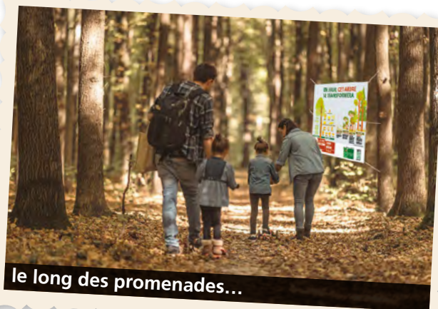
le long des promenades...