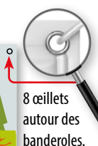
8 œillets autour des banderoles.

Chaque BANDEROLE est prévue pour être fixée à l'aide d'œillets matérialisés tout autour du visuel.