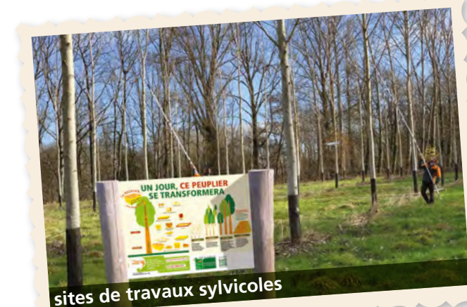
sites de travaux sylvicoles

Chaque BANDEROLE est prévue pour être fixée à l'aide d'œillets matérialisés tout autour du visuel.