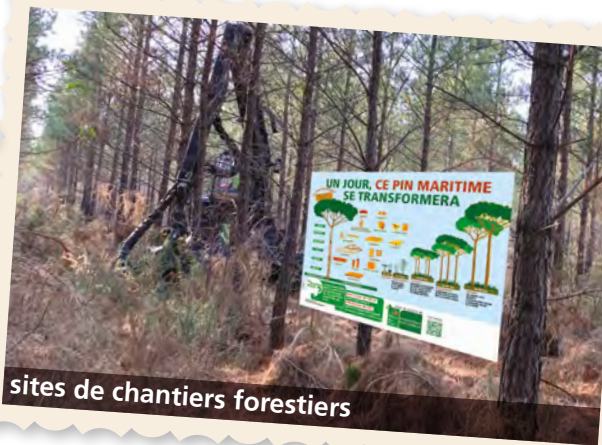
sites de chantiers forestiers

Vous pouvez personnaliser CHAQUE BANDEROLE en inscrivant VOTRE LOGO dans la zone prévue à cet effet.