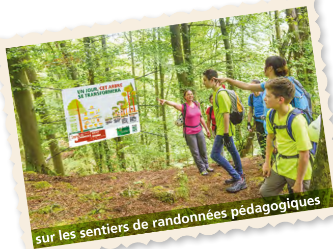
sur les sentiers de randonnées pédagogiques

Donnez de la visibilité à vos banderoles en environnement forestier, exposition, salle de cours, etc.