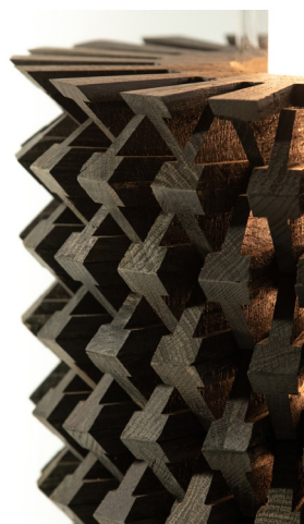
Détail du luminaire Immorta (détail) : Chêne de Morta design Nodesign fabrication : Atelier IKEB.