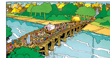
La Serpe d'Or, page 11