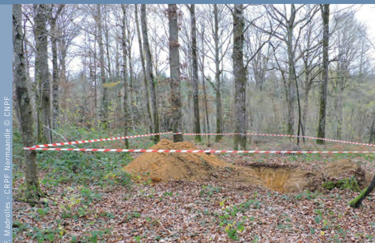
F. Madrolles - CRPF Normandie © CNPF