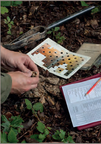
S. Gaudin - CRPF CA © CNPF