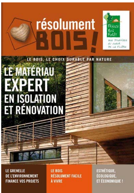
ISOLATION - BARDAGE