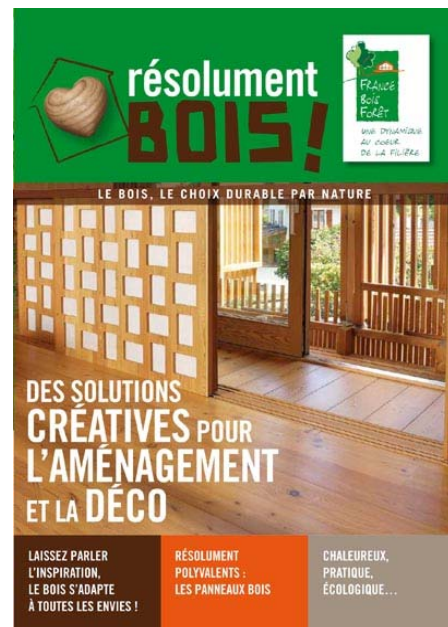
AMENAGEMENT - DECORATION